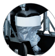
Longopac-system för filterenhet