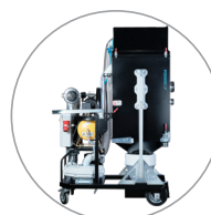
HEPA + Longopac (LP) version

Stoftavskiljare VCE3000C imponerar med sin höga prestanda och bygger på en optimal kombination av maximalt undertryck och högt luftflöde.