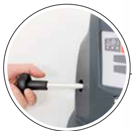
Effektiv rengöring av filter.