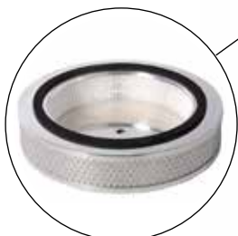
Hepa 14 suodatin 99.995% suodatustehokkuus.