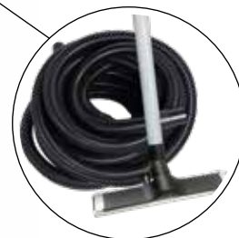
Toimitetaan mukana 10 m letku ja puhdistussarja.