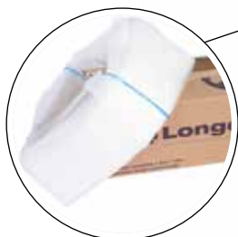
Longopac® pussijärjestelmä, varten turvalliset, helpot ja pölyttömät vaihdot.