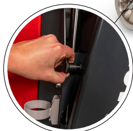
Höj- och sänkbar cyklon för bättre transportmöjligheter