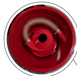
Inbyggd föravskiljare, 90 % föravskiljning