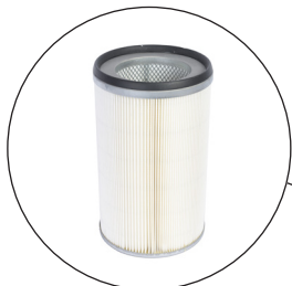
Hepa 14 filter 99.995 % filtrering