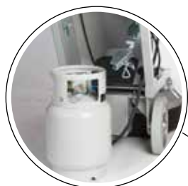
Drivs med 100% gasol