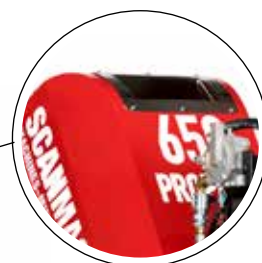
Utrustad med 22 liter vattentank