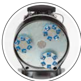
Utrustad med vårt patenterade drivsystem, med tre sliphuvuden