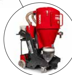
Rekommenderad dammsugare: Scanmaskin 9000 WS Scanmaskin 9000 WS-propan