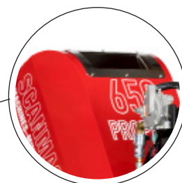
Utrustad med 22 liter vattentank