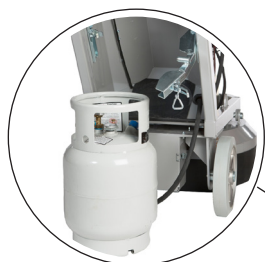
Drivs med 100% gasol