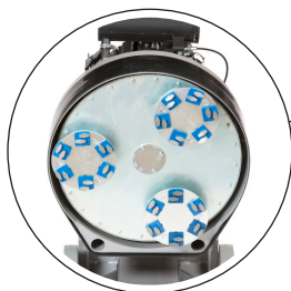
Utrustad med vårt patenterade drivsystem, med tre sliphuvuden