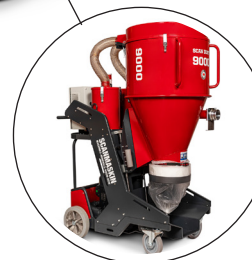
Rekommenderad dammsugare: Scanmaskin 9000 WS Scanmaskin 9000 WS- propan